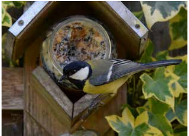
Koolmees bij zijn wintermaal