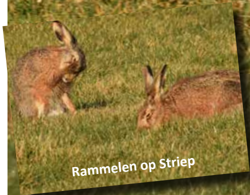
Rammelen op Striep